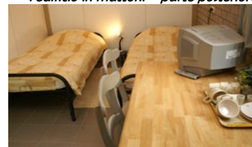
la stanza con terrazza